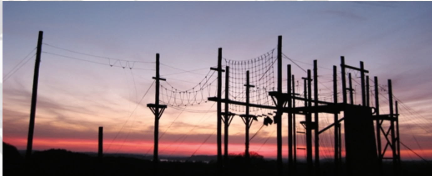
Unvergessliche Momente auf dem Hochseilgarten