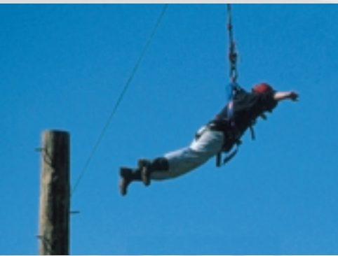
Sprung vom Pamper Pole